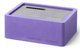
XT Starter, コンプリートセット

パープル : #432025 オレンジ : #432027 グリーン : #432026 ピンク : #432028