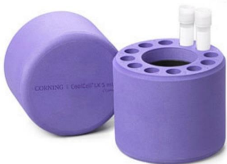
CoolCell 5 ml LX

パープル : #432006 オレンジ : #432007 グリーン : #432008 ピンク : #432009