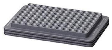
CoolSink XT 96U