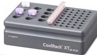
CoolRack XT M-PCR

12本×1.5/2.0mlマイクロチューブ + 48本×0.2ml PCRチューブ