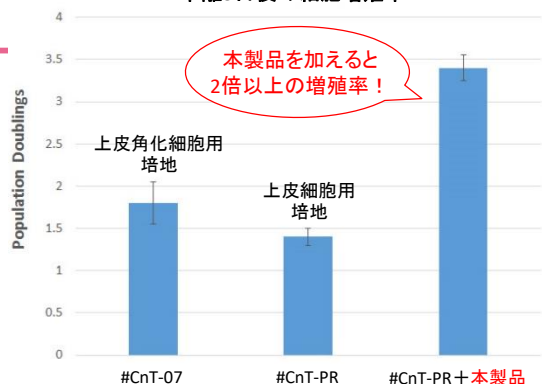
単離3日後の細胞増殖率