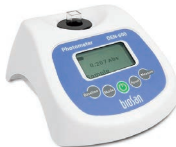
12.0 W ×14.5 D ×6.5 H cm, 0.5 kg