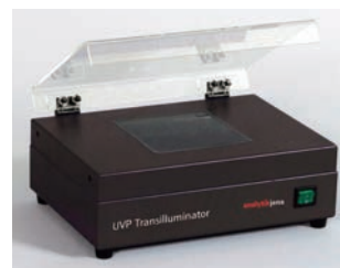
26.0 W ×18.4 D ×11.4 H cm