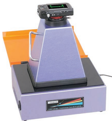
[Web ページ番号 : 71807]