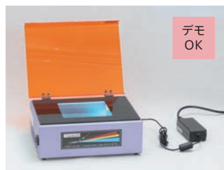
29.0 W ×23.0 D ×10.0 H cm、2.2 kg