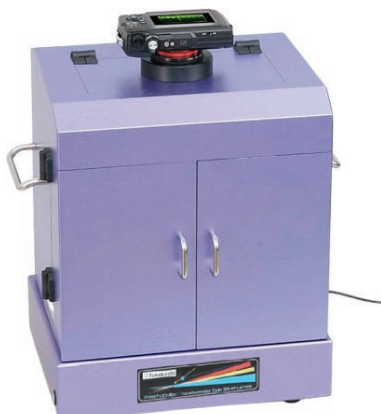
[Web ページ番号 : 71808]