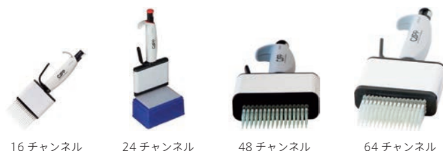
16 チャンネル 24 チャンネル 48 チャンネル 64 チャンネル

分解せずにオートクレーブできます (ノブは除きます)。詳細はフナコシ Web をご覧ください。