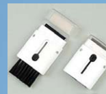
2way パソコンクリーナー