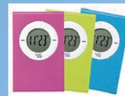
デジタルタイマー ※色はご指定いただけません。