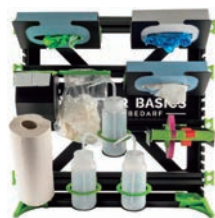
消耗品をまとめて収納できるラック